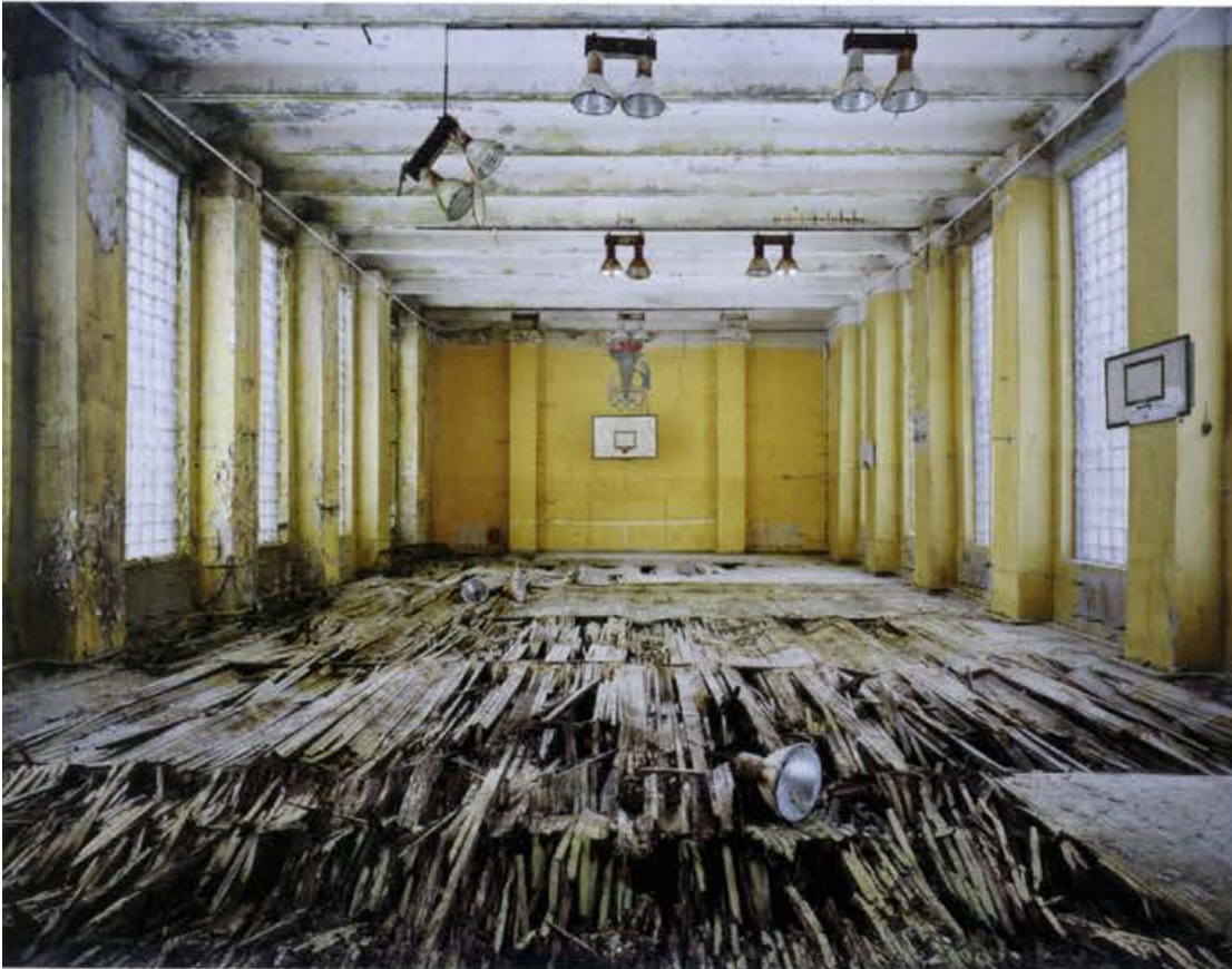
« Quête des Soviets ». Basketball, Gymnase, Brandebourg/Allemagne 2010.