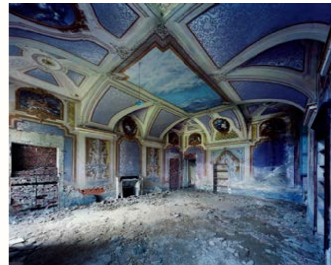
06: Porpora, Piedmont, 2010