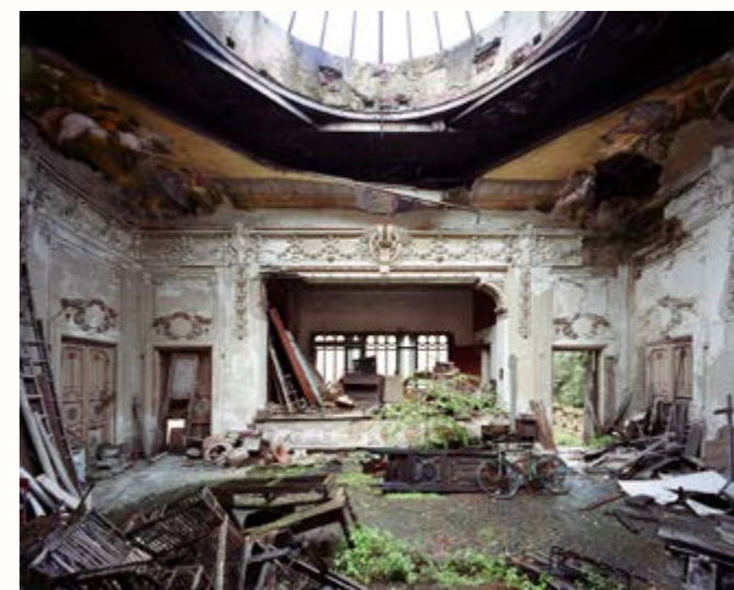
04: Sfuliata, Tuscany, 2019