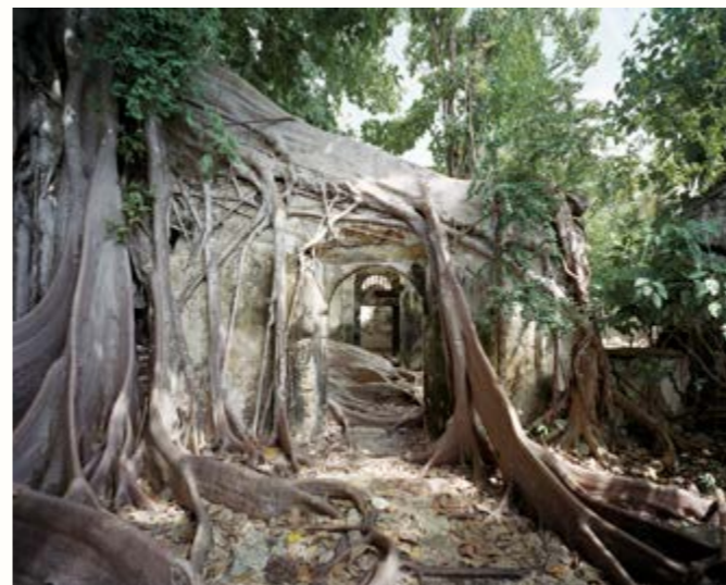
05: Prison, Petit-Canal, Guadeloupe