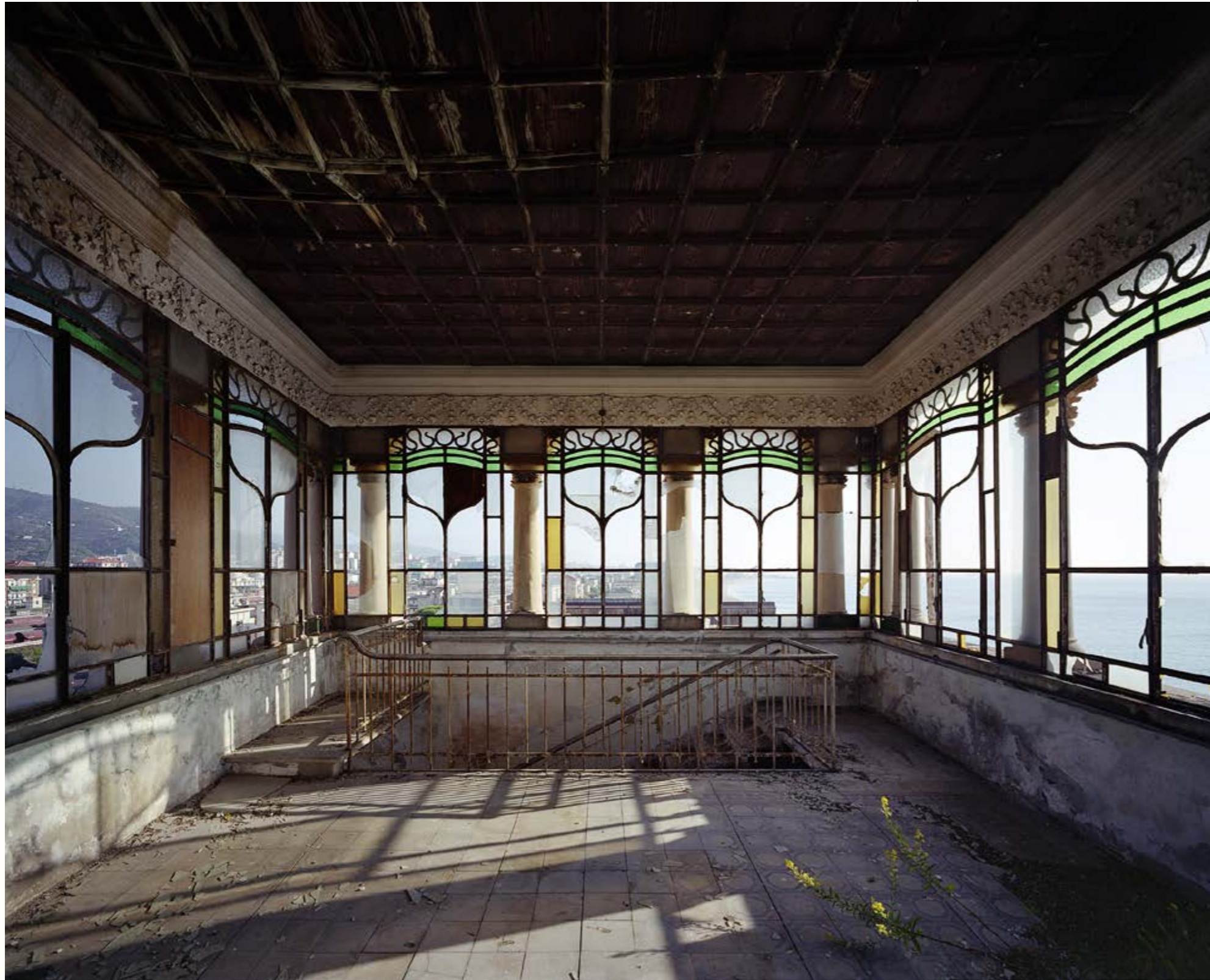
09: Vedetta, Liguria, 2018