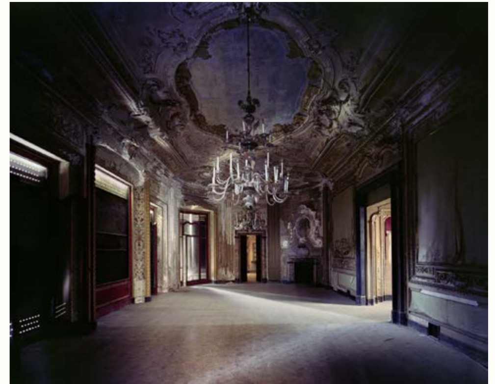
11: Ghepardi, Lombardia, 2016