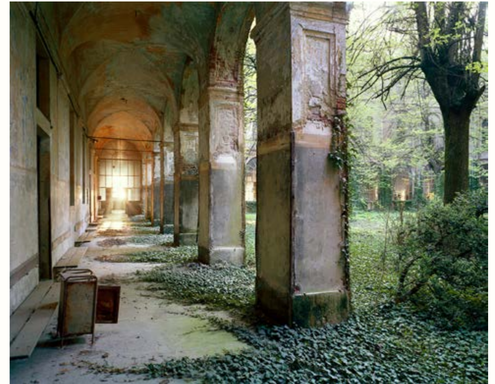
10: Splendore Piedmont, 2011