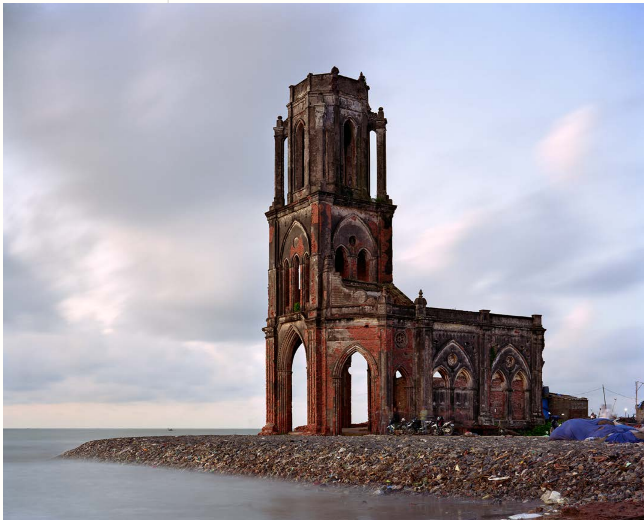
01: Eglise du sacre Coeur, Vietnam

无师自通的乔瑞昂仅利用自然光和一架大画幅相机就完成了他的创作。第一本书《寂静》关注了“寂静”“另一个美国”“便利店”等主题，随后出版的作品《帝国的废墟》(Vestiges d'Empire) 则专注于探索遍布全球的前法国殖民地。这些照片曾在巴黎摄影博览会展出，并很快被巴黎乃至世界范围内的博物馆和机构收藏，比如法国普尼斯摄影博物馆、EDF 基金会和墨尔本的维多利亚国家美术馆。