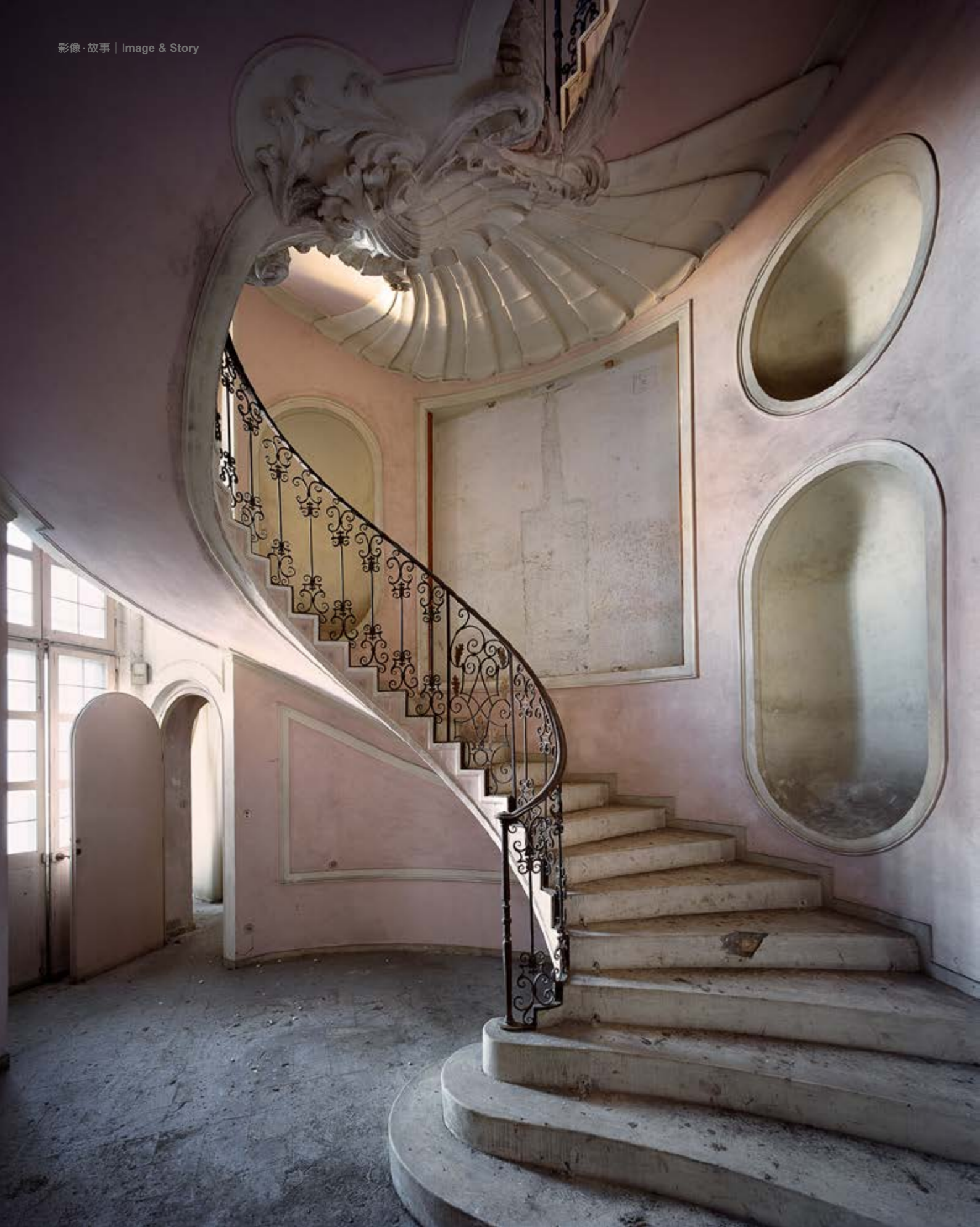
07: Pellegrino, Piedmont, 2017