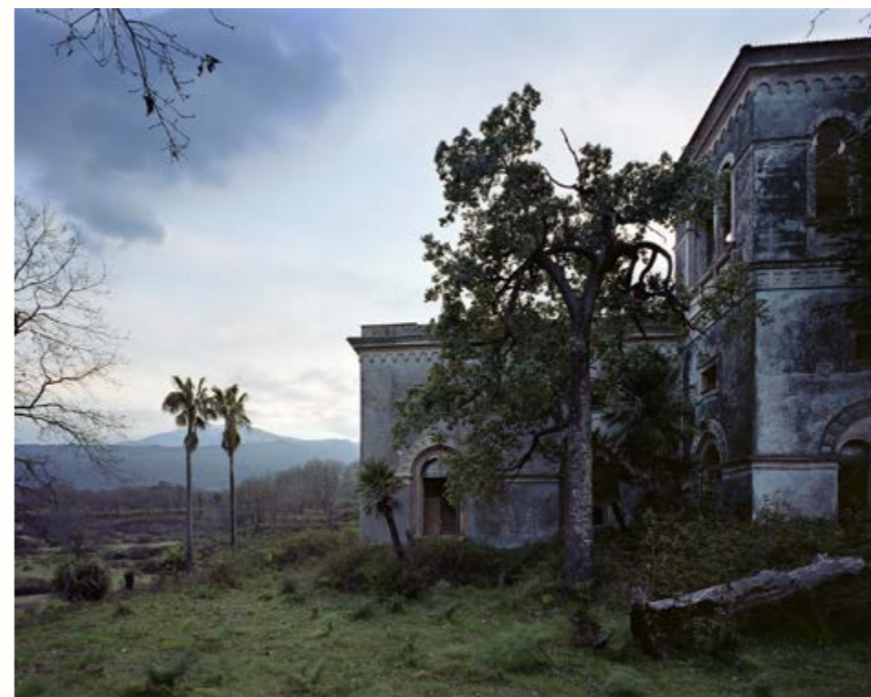
08: Tra il fosco e il fosco, Sicily, 2020

是重中之重。不过摄影毕竟是多种要素的集合，最起码要包括构图、光线和色彩。只有这些要素完美并存时，我才会感到满意。这就像作曲，你要不停挑选音符，直到创造出很棒的旋律。但是，我很坚定的是：优先考虑构图、取景，然后让照片完美地呈现被摄对象，不需要任何后期修饰。