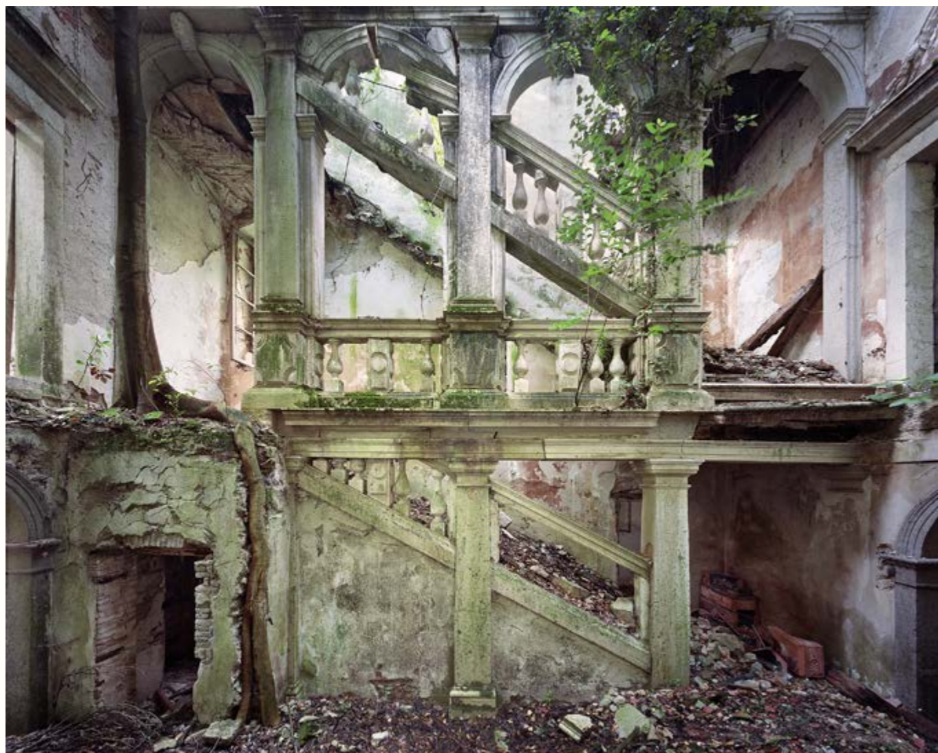
02: Fulmine, Friuli Venezia Giulia, 2018